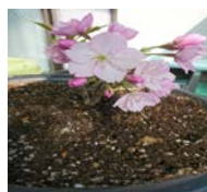
盆栽の桜が咲きました

今回は食品添加物についてお話させていただきます。日本は各国では規制されているものも流通しています。東南アジアでは野犬の捕獲にはOの素を大量に振りかけた肉を食べさせて麻痺がでたところを捕獲するようです。また缶詰の果物の皮はなぜあんなに綺麗にむけていると思われませんか？塩酸で皮を溶かしているからです。またパックサラダの野菜を変色させない為には消毒液と防腐剤が使われています。ソルビン酸カリウムという保存剤はたくさんの食品に使用されており着色剤（赤色 102 号・106 号、黄色 4 号、青色 1 号など）と同様に発ガン性があります。食品を選ぶ時は安さに惑わされず成分表や食品添加物の記載などを必ず見てください。自然なもの、旬のものを選び外食する場合もホームページなどを見て確かなオーナーの店舗で召し上がってください。病気になることが何よりなのです。日頃から軽い運動を心がけ血糖の上昇を抑える為に野菜から召し上がってください。体重計にも毎日乗ってください。耳の痛い話ですが小さなことの積み重ねと注意でも健康管理しましょう♪